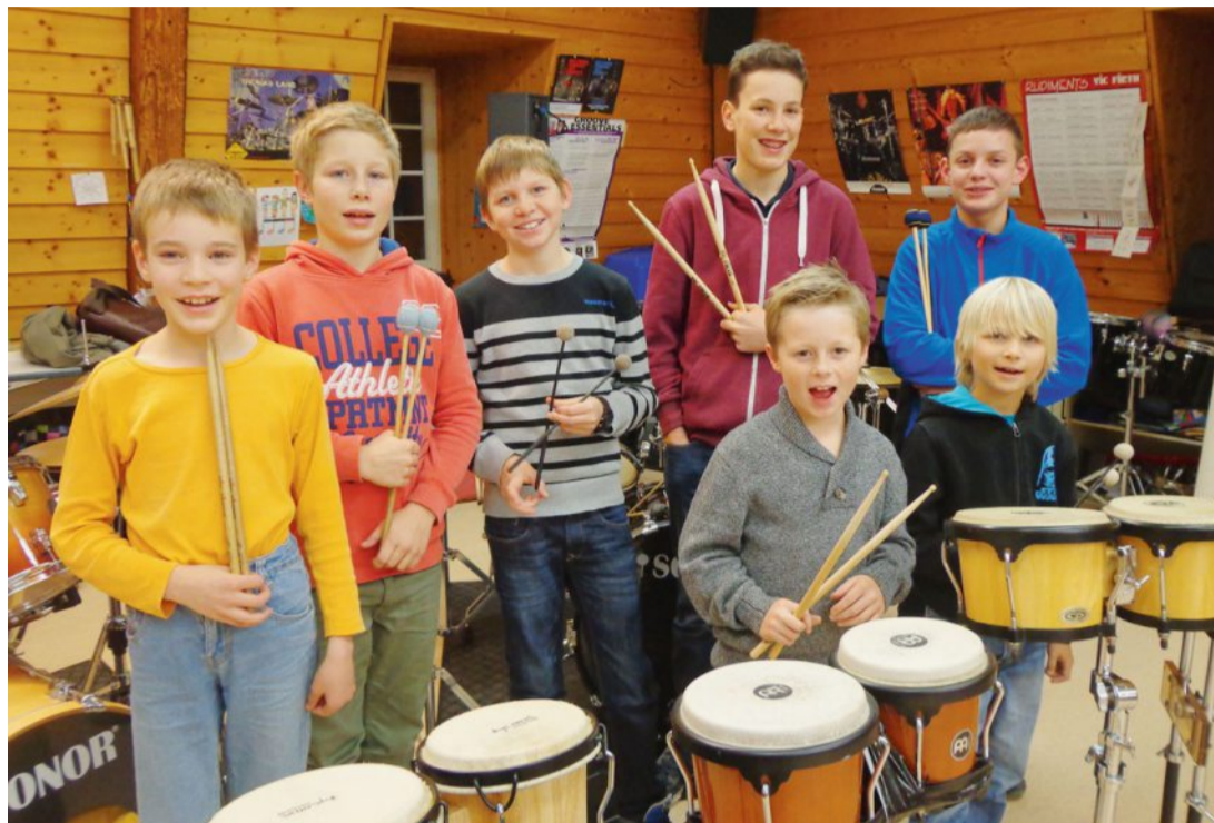
Am Sonntag hauen im Anker-Haus-Garten Schüler der Musikschule Seeland auf die Pauke. tsj

Trommeln sind kaum abhängig von einem bestimmten Instrument. Mit dem Einsatz des Körpers oder einfacher Gegenstände wie Stöcke, Becher, Rohre, Bambus oder Bänder können Töne erzeugt werden. Rhythmusspiele fördern vor allem Konzentration,